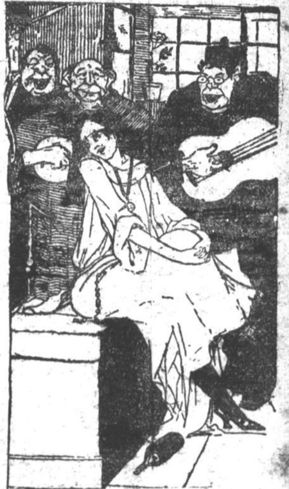
— Grande paix é este! Nós commetemos os nossos peccadinhos e os que nos accusam vão aos tribunaes... Folgemos em sua honra!

Uma dama pobre, que encobria as suas faltas de castidade com o manto da religião, tinha adoptado por divisa estas palavras: Honra a Deus. Um gaiato: transpuz as palavras pela seguinte fórma: Adeus honra.